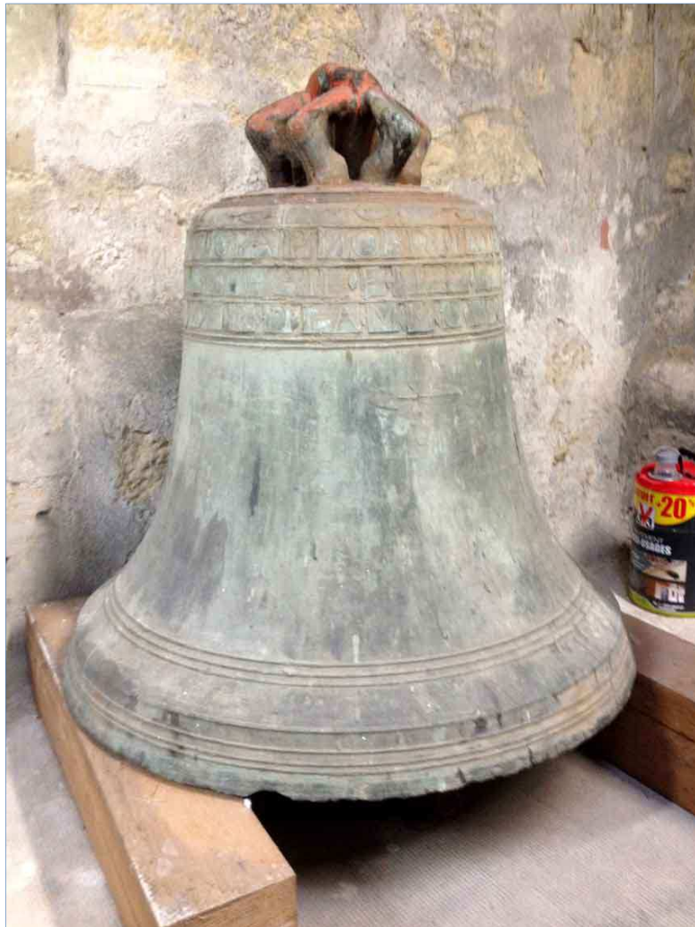
Cloche Saint-Nicolas : état au 10 Octobre 2017 6